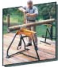
何処の現場にも簡単に持ち運べます。