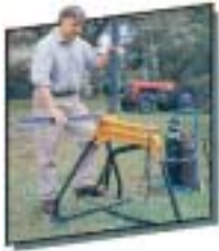
ハンドフリークランピングにより両手が自由に使えます