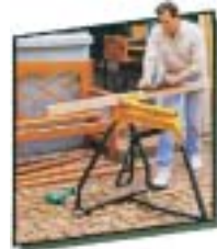
人間工学に基づいたデザインにより効率良く且つ安全に作業できます