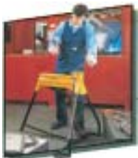
丈夫な構造で鉄工作業にも対応

トリトン独自の画期的な多目的万能バイスベンチ スーパージョーズはその名の由来通りサメの顎のごとくあらゆる加工材を確実にホールドし作業の大幅な効率アップが望めます。トリトン社が世界に誇る傑作の1台です。特に、木工、鉄工加工をされる方にとって最も利用頻度の高い工具の1つであり一度使えばもう手放せません。