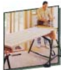
幅広い部材も瞬時に固定します。最大幅900