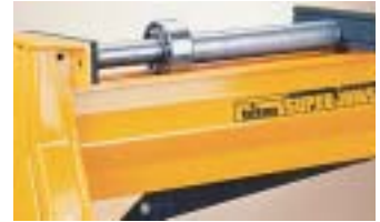
最大1000kgの力で締め付けます