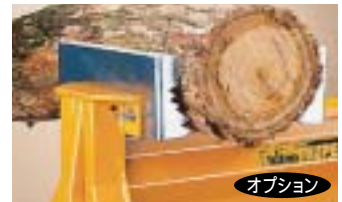
ログ&ポールジョーズ

材質は極めて強固な鋳物製で50 水道管のネジ切り、レンチでの締め付けなど、さまざまな鉄工作業に対応します。