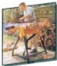
安定性が高くあらゆる地形で使用できます。チェーンソー作業にも最適です。